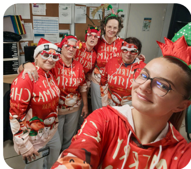
Même à domicile, nos salariés ont transmis l'esprit festif des fêtes de fins d'année!