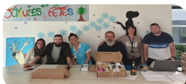
Le CSE lors de l'après midi de Noël pour les salariés