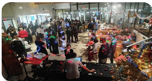
Soirée Inter Générations à Loumet