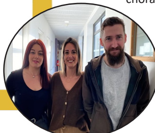
La TEAM vie sociale de l'EHPAD des Sources a offert aux familles de nos résidents une vidéo, dans l'esprit de «vis ma vie».

Nos aînés ont partagé un moment de convivialité autour de spectacles et de gourmandises festives. Les plus jeunes se sont émerveillés lors d'ateliers créatifs et de la venue tant attendue du Père Noël. Nos salariés et administrateurs ont clôturé l'année avec un chaleureux moment d'échanges, célébrant une année de travail collectif et de belles réussites. Merci à tous ceux qui ont participé et contribué à faire de ces moments des souvenirs précieux.