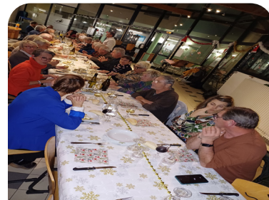
Conseil d'Administration commun de décembre.

Nos aînés ont partagé un moment de convivialité autour de spectacles et de gourmandises festives. Les plus jeunes se sont émerveillés lors d'ateliers créatifs et de la venue tant attendue du Père Noël. Nos salariés et administrateurs ont clôturé l'année avec un chaleureux moment d'échanges, célébrant une année de travail collectif et de belles réussites. Merci à tous ceux qui ont participé et contribué à faire de ces moments des souvenirs précieux.