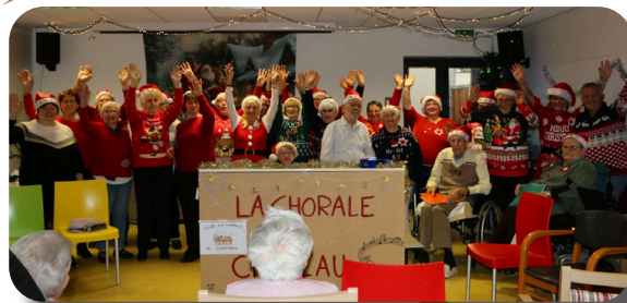
Messe de Noël animé par la chorale du Château.