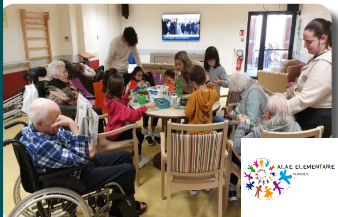
De nombreuses activités ont lieu dans le cadre du partenariat avec l'ALAE de VERNOLLE, qui permettent les échanges intergénérationnels.