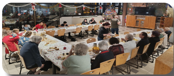
Repas du réveillon à Loumet.

Cette année encore, nos associations ont célébré les fêtes avec des animations pour tous :