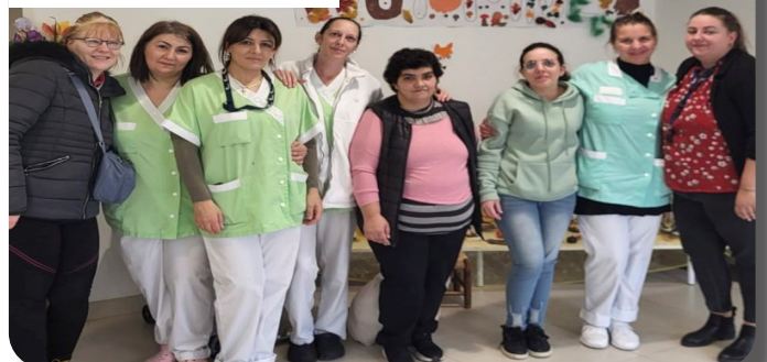
A l'EHPAD des Sources, le DUO DAY manifestation pour l'insertion au travail des personnes en situation de handicap a eu lieu avec des travailleurs de l'ADAPEI 09.