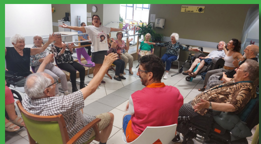
EHPAD LE CHATEAU