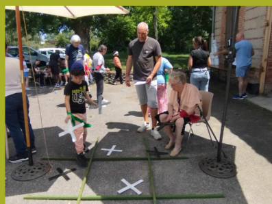
Mercredi festif à Loumet, activités jeux, sports