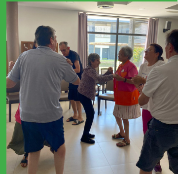
EHPAD DES SOURCES

Nous le savons le rire est bon pour la santé! Les résidents de l'EHPAD des Sources et l'EHPAD Le château ont pu expérimenter le YOGA du RIRE. Merci aux Blouses Roses qui ont financé cette activité pour nos résidents.